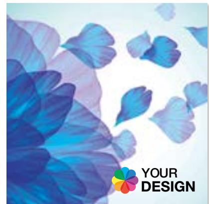
Ansicht des fertigen Universal-Microfasertuchs

• Wir empfehlen diese Angabe aufgrund der Textilkennzeichnungsverordnung.